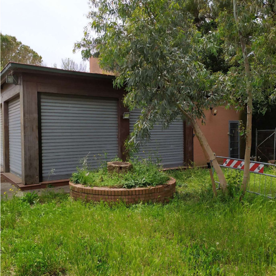
FOTO LOCALI OGGETTO DI BANDO